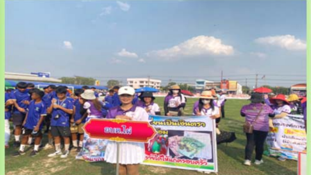
กิจกรรมงานแข่งเรืออำเภอราชไสล