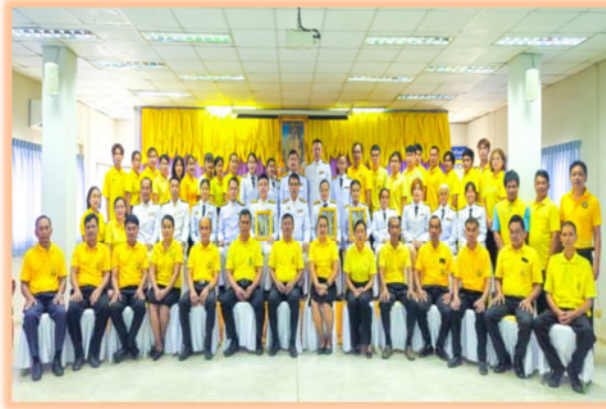
กิจกรรมนุ่งผ้าไทยใส่บาตรฯ