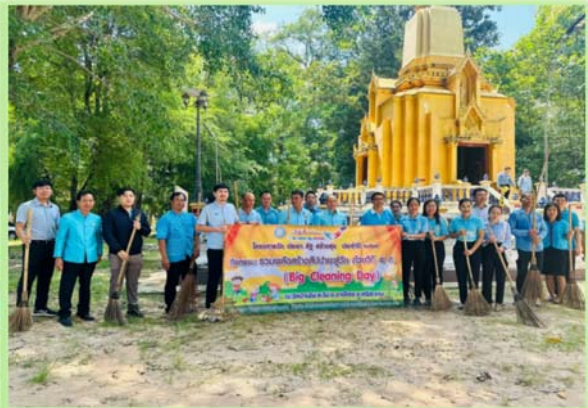
กิจกรรมโครงการรักษน้ำ รักป่า รักษาแผ่นดิน