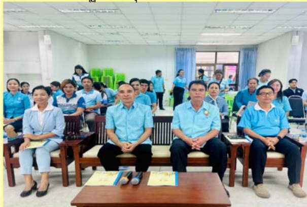
กิจกรรม วัด ประชา รัฐ สร้างสุขฯ