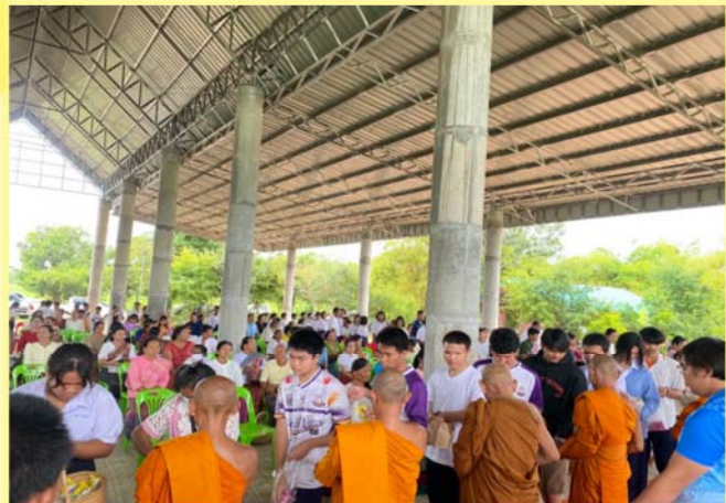
กิจกรรมอบรมคุณธรรมและจริยาธรรมฯ