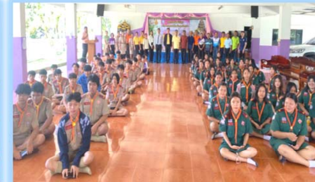
กิจกรรมรณรงค์ต่อต้านยาเสพติด