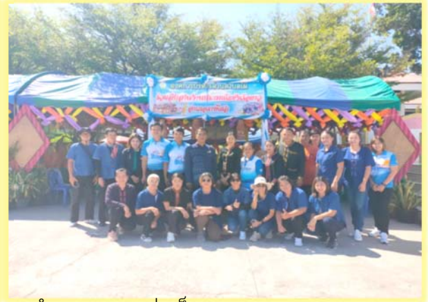
กิจกรรมการป้องกันและแก้ไขการกระทำความรุนแรงต่อเด็กฯ